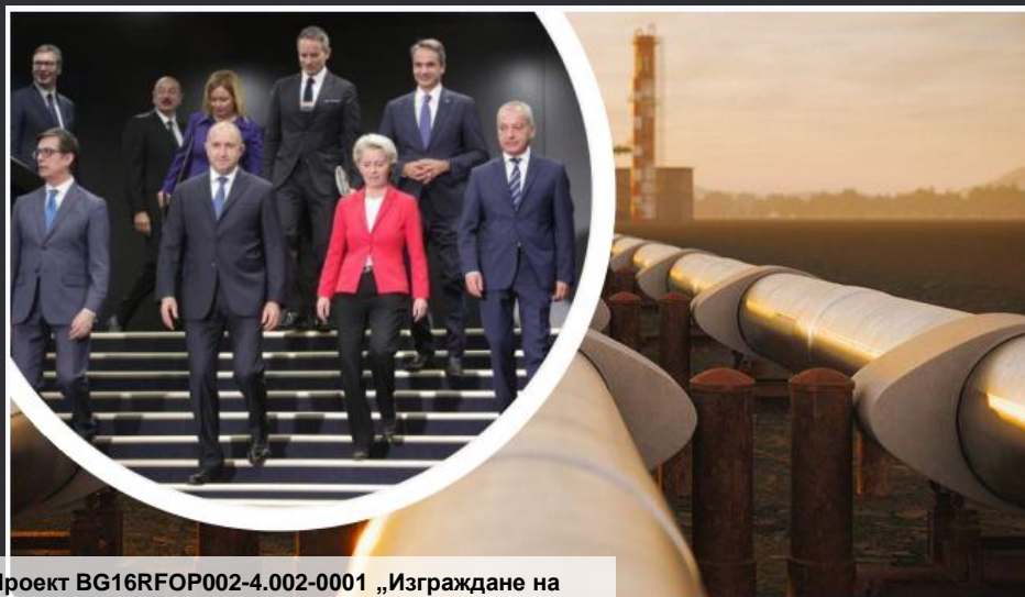
Проект BG16RFOP002-4.002-0001 „Изграждане на междусистемна газова връзка Гърция-България“

Със средства по ОПИК са изградени 29,6 км. от газопровода на територията на България. Междусистемната газова връзка Гърция – България е проектирана за пренос на природен газ между двете страни чрез свързване на газопреносителните им мрежи. Общата дължина на газопровода е 182,5 км., от които 31,6 км. на територията на Гърция и 150,9 км. - на територията на България.