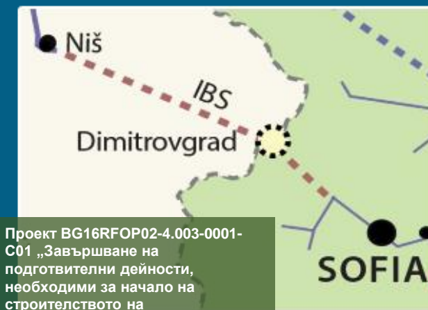
Проект BG16RFOP02-4.003-0001-C01 „Завършване на подготвителни дейности, необходими за начало на строителството на Междусистемната газова връзка България – Сърбия“